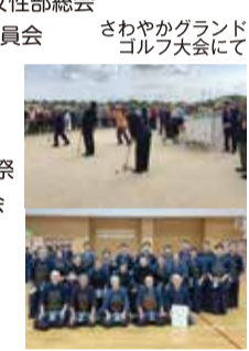
さわやかグランドゴルフ大会にて