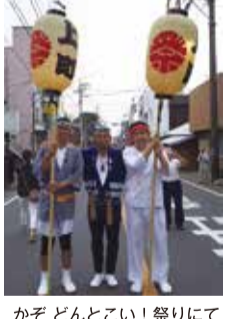
かぞ どんとこい!祭りにて