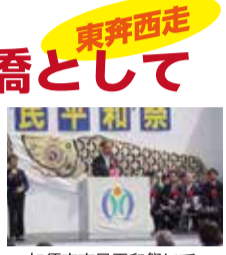
加須市市民平和祭にて