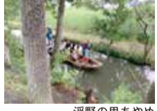
浮野の里あやめ祭りの風景