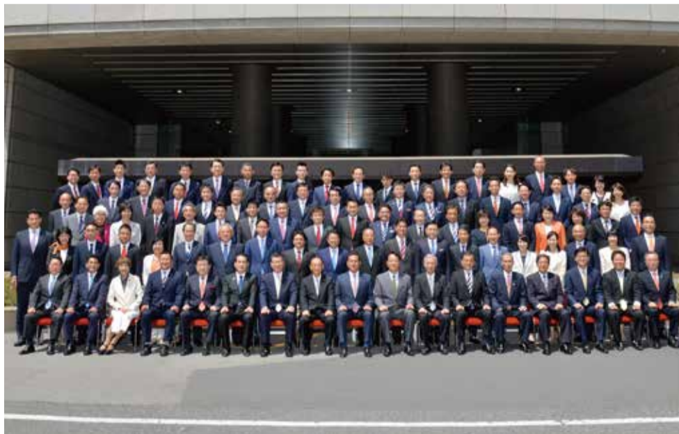
埼玉県議会議員全93名(令和元年5月17日議事堂前撮影)